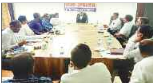
बैठक लेते प्रधान न्यायाधीश।