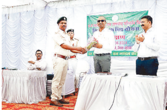
अतिथियों का सम्मान करते वन कर्मचारी।