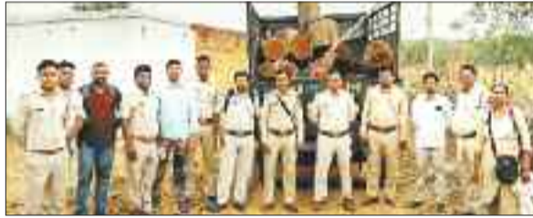
जात चिरान के साथ वन अफसर।