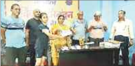
प्रतिभागियों को पुरस्कृत करते कार्यक्रम के अतिथि।

चयन स्पर्धा के आधार पर विजयी खिलाड़ी आगामी माह 24 से 28 जुलाई को बिलासपुर